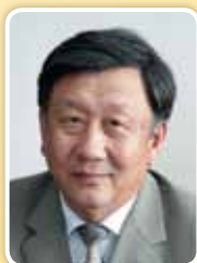
Евгений Лхамациренович ЧОЙЗОНОВ

академик РАМН, председатель Сибирского отделения РАМН; директор НИИ физиологии Сибирского отделения РАМН