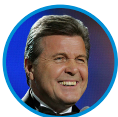
Лев ЛЕЩЕНКО народный артист России