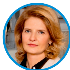
Наталья КАСПЕРСКАЯ генеральный директор компании «InfoWatch»