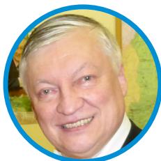
Анатолий КАРПОВ гроссмейстер, первый заместитель председателя Комитета Государственной думы ФС РФ по экономической политике, инновационному развитию и предпринимательству